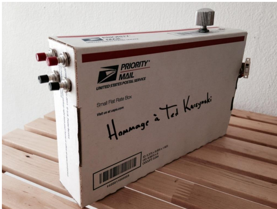
Eduardo F. Rosario Rosario Hommage à Ted Kaczynski . 2013 Circuit-bent children's toy, cardboard box 8 11/16" x 5 7/16 x 1 3/4"